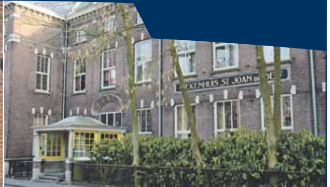
Voormalig ziekenhuis met klooster aan de Papenhulst