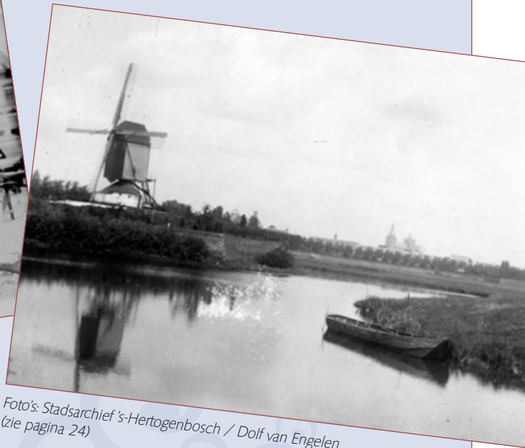
(zie pagina 24)