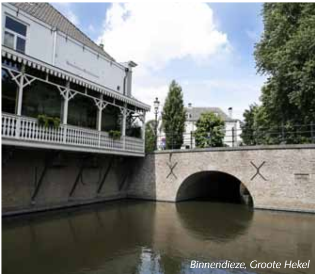
Binnendieze, Grote Hekel