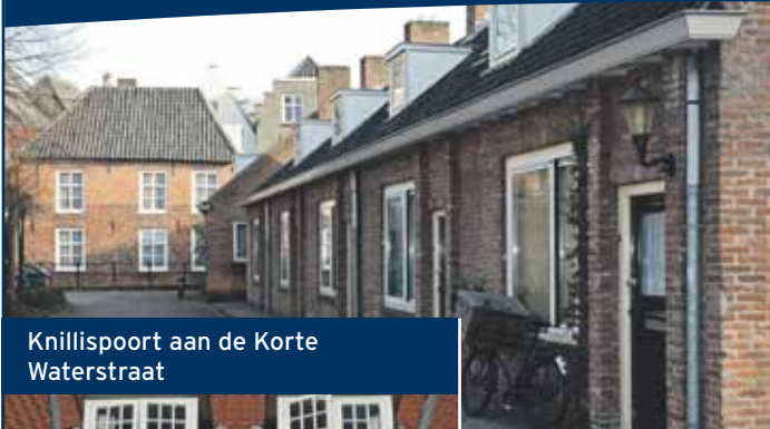
Knillispoort aan de Korte Waterstraat